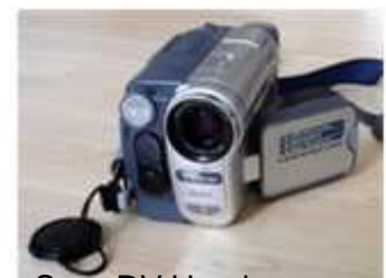
Sony DV Handycam