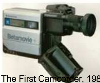
The First Camcorder, 1983

Salah satu alat yang dapat digunakan untuk menghasilkan video digital adalah camcorder , yang digunakan untuk merekam gambar-gambar video dan audio, sehingga sebuah camcorder akan terdiri dari camera dan recorder . Macam-macam camcorder: miniDV, DVD camcorder, dan digital8.