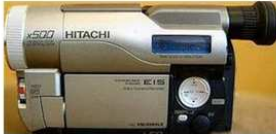
Hitachi Digital8 Camcorder